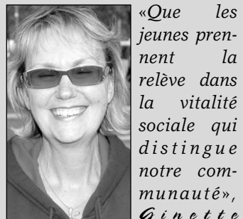
Bélisle de la ferme G. Perreault.