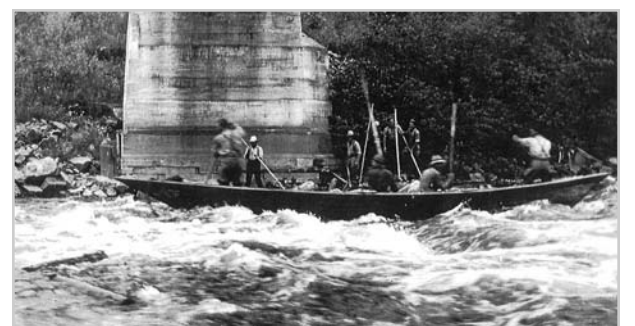
On saute des chutes!