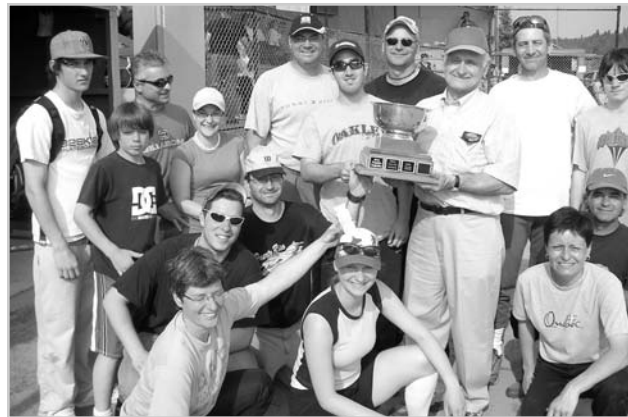
Les Pilon défendent leur titre de champions de 2007 lors du 13 e tournoi de balle familial de La Conception.

Pour une 13 e année, on tiendra un tournoi de balle familial au profit de l'église locale du 6 au 8 juin au parc municipal. Une douzaine de familles concourront amicalement pour voir inscrit le nom de leur famille gagnante sur la trophée Charles-Auguste Labelle. Une compétition humoriste parallèle, à la course renversée des buts, entrecoupera les joutes régulières.