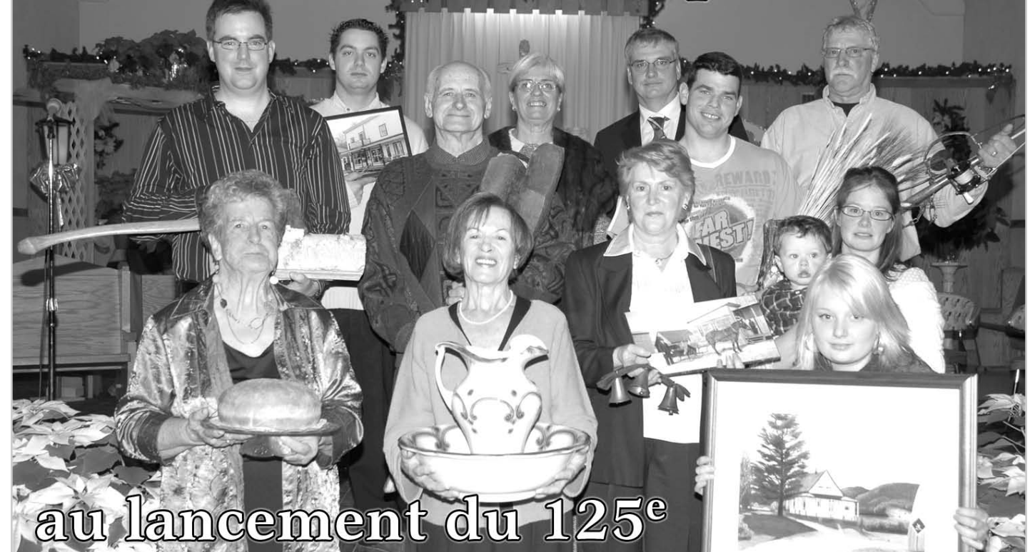
Les festivités du 125 e anniversaire de La Conception ont été lancées lors de la messe de Noël du 24 décembre. On y a rendu hommage à 16 familles souche ayant toujours des descendants dans la communauté. Des représentants de 11 de ces familles pionnières ont déposé, au pied de l'autel, des objets rappelant la mémoire de leurs aïeux. Les familles participantes étaient les Clément, les Valiquette, les Pilon d'Alfred, les Gareau, les Champagne, les Charbonneau, les Giroux, les Forest, les Auger, les Bélanger et les Papineau. Plus de détails en page 2.