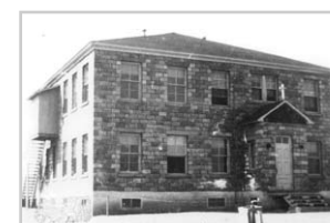
École Notre-Dame au village bâtie par Charles Auguste Labelle en 1971. Cette école serait dans le stationnement Est de l'hôtel de ville.