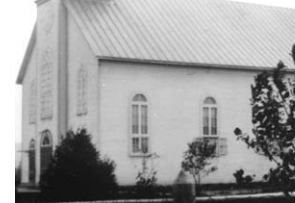
L'église de l'époque, quelle beauté!