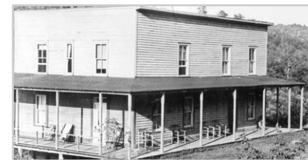
Vestige du développement touristique local, la Pension Forest à l'entrée du lac des Trois-Montagnes (appelé lac Simon à l'époque) est disparue en 1977.