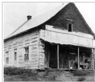
Plusieurs maisons d'époque comme celle de la ferme Hardy ont grandement été modifiées ou ont disparu avec le temps.

Le 27 janvier 1977, l'ancienne Pension Forest devenue l'Hôtel Béland, construite en 1910 pour accueillir les amateurs de chasse et pêche au lac des Trois-Montagnes, est victime du feu. Ce vestige du développement touristique local n'est plus. Henri-Paul Béland construit un dépanneur et poste d'essence pour continuer à desservir les villégiateurs. Finalement, en 1977, le magasin Joseph Saindon du village devenu le magasin Réjean Lévesque brûle.