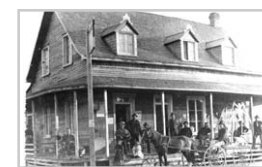
L'Hôtel Saint-Jean était très populaire et bien située près de la gare.