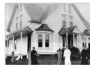
Le presbytère construit en 1895.

Gilles Bessette, alors adolescent, se souvient. Informé de l'incendie par un voyageur de commerce de passage à la ferme familiale, il a enfourché sa bicyclette pour descendre au village. «Une pompe installée