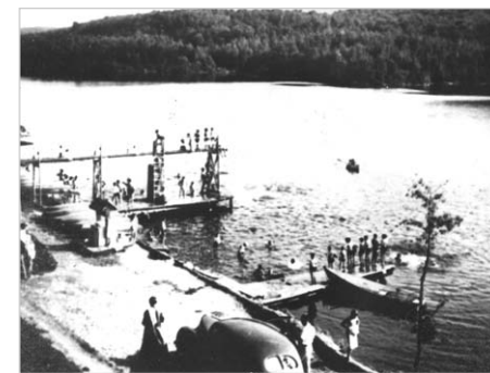
Cette photo de la Pension Vinet démontre sa popularité des années '20 à '40 au lac Xavier.

les rives des lacs. Dans les années '40 et '50, le gouvernement consent à signer de nombreux baux de location à long terme et à peu de frais pour des lots bordant les lacs à condition que les locataires défrichent et construisent. Le pourtour des lacs se meuble alors de camps estivaux, même dans les parties sans accès routier. Ces villégiateurs donnent du travail à plusieurs Conceptionnois dans la construction et l'entretien de leurs camps.