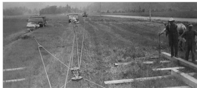
On tire lentement l'hôtel à travers les champs vers son nouvel emplacement, le même qu'aujourd'hui.