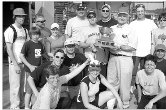
Les Pilon défendent leur titre de champions de 2007 lors du 13 e tournoi de balle familial de La Conception.

Pour une 13 e année, on tiendra un tournoi de balle familial au profit de l'église locale du 6 au 8 juin au parc municipal. Une douzaine de familles concourront amicalement pour voir inscrit le nom de leur famille gagnante sur la trophée Charles-Auguste Labelle. Une compétition humoriste parallèle, à la course renversée des buts, entrecoupera les joutes régulières.