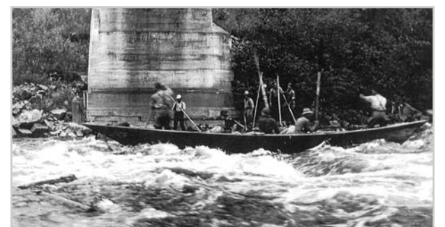
On saute des chutes!